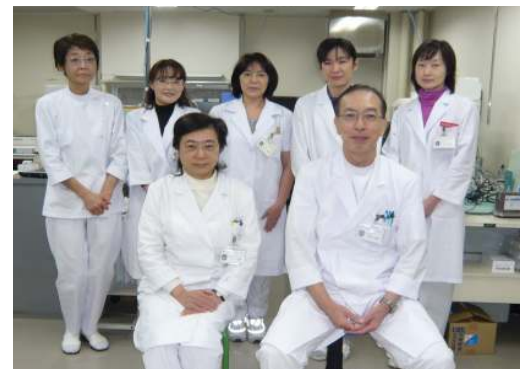
臨床検査科スタッフ