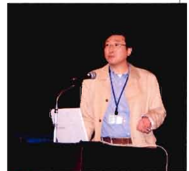
講演 「知っておきたい薬の知識」