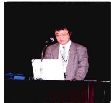
講演 「骨粗鬆症について」